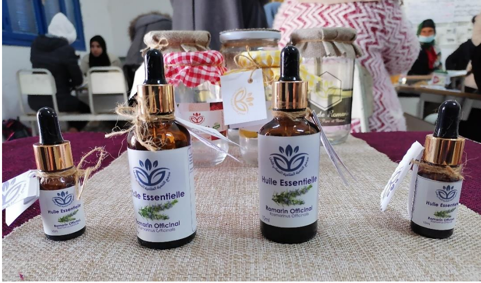
صورة رقم 7 : بعض الأمثلة للمنتوج النهائي لمجموعات العمل