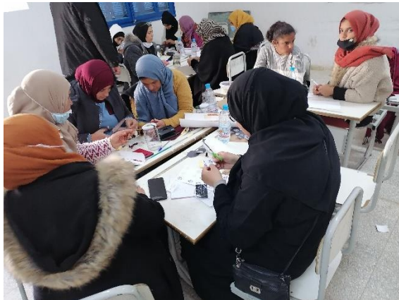
صورة عدد 6 : عمل جماعي في تحضير الملصقات

نُظمت هذه الجلسة في مجموعة من ورشات عمل، هدفها تصميم وإنجاز أغلفة وملصقات مناسبة لبعض منتوجاتهن مثل مربى الغلال والهريسة والعسل وغيرها من المنتجات. فيما يلي بعض الصور لورشات العمل وبعض الأمثلة للمنتوج النهائي.