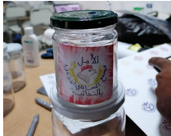
صورة رقم 3 : مثال للشعار المقترح من إحدى مجموعات العمل