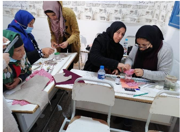
صورة رقم 5 : عمل جماعي في تحضير الأغطية