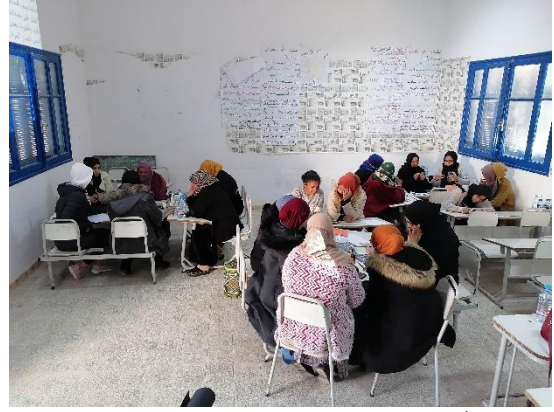
صورة رقم 1 : مجموعات عمل لتحضير شعار مقترح