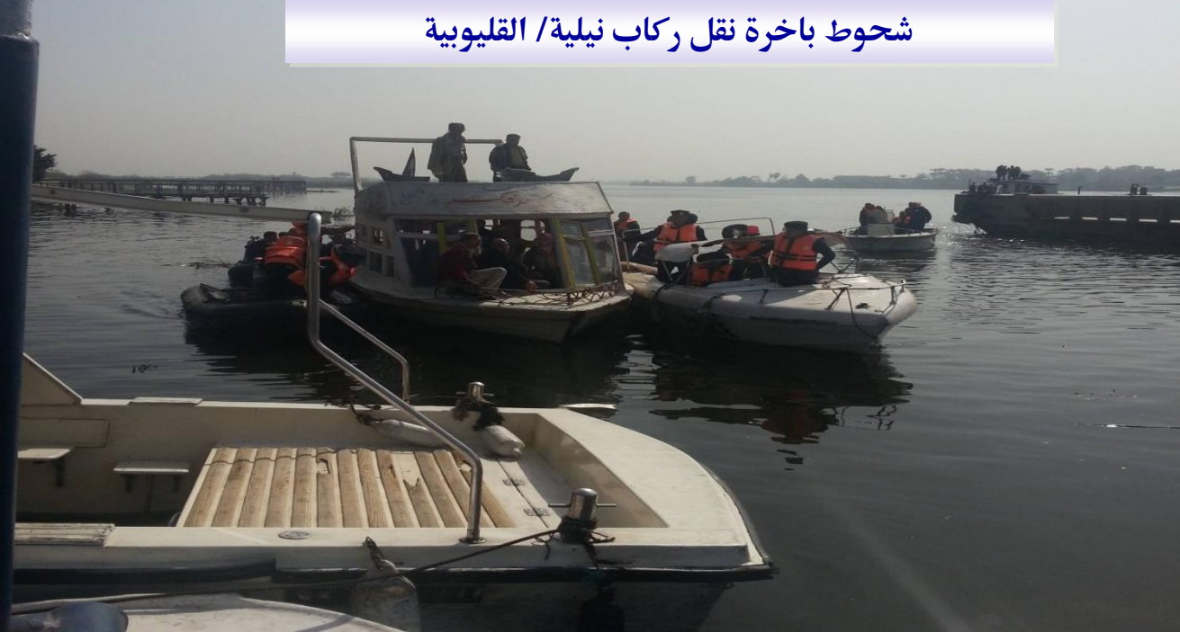
شحوط باخرة نقل ركاب نيلية/ القليوبية