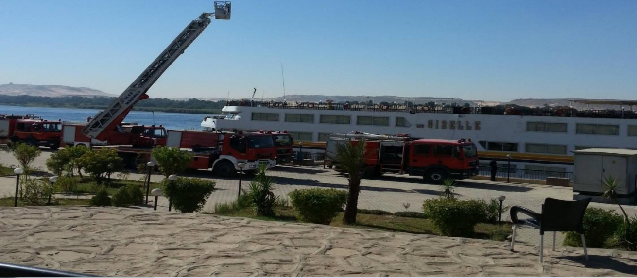
حريق باخرة سياحية/ أسوان