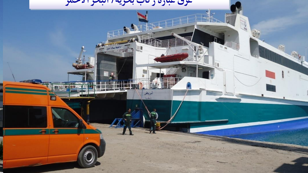
غرق عبارة ركاب بحرية/ البحر الأحمر