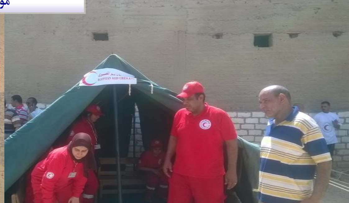
محاضرات التوعية لطلاب المدارس