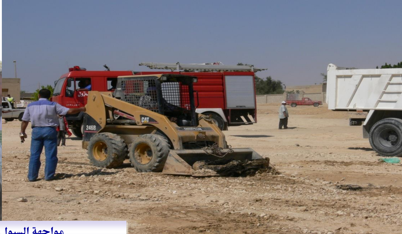
مواجهة السيول / جنوب سيناء