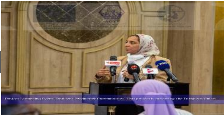
Project Launching Press "Sustainable Production Communities" This project is funded by the European Union