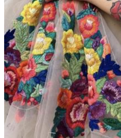
◦ القماش على أنواعه