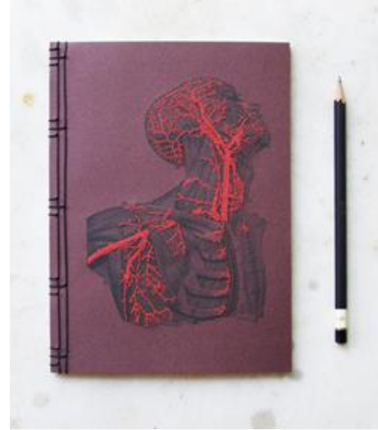
◦ الورق والكرتون