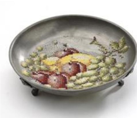
◦ الحديد المثقوب