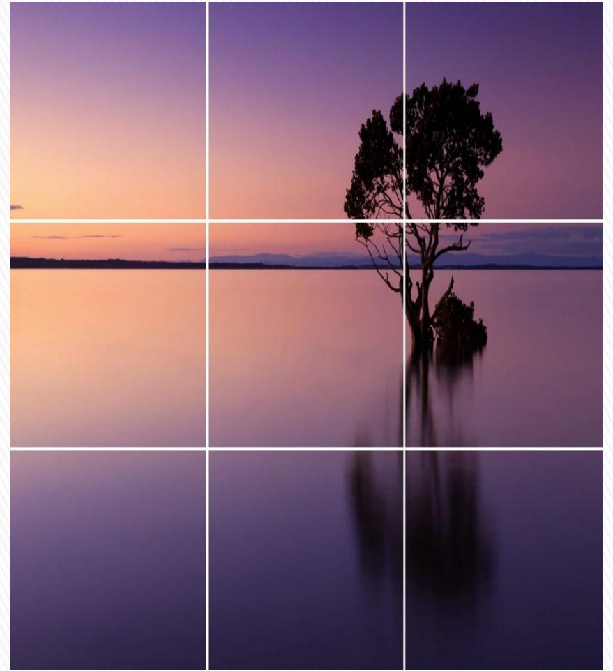
الشجرة وظلها في الثلث الايمن من الصورة