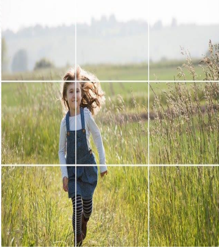
الفتاة في الثلث الايسر من الصورة