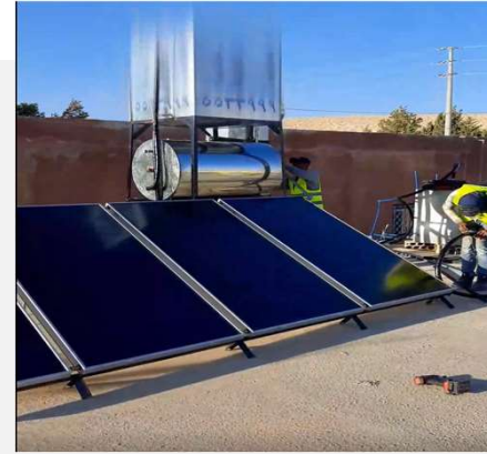
نظام طاقة شمسية سعة 4 كيلو واط، في مبنى سكني في بتير، الكرك، الأردن