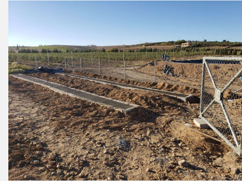
نظام طاقة شمسية سعة 22 كيلو واط قيد التنفيذ في مزرعة في الأشعري، معان، الأردن