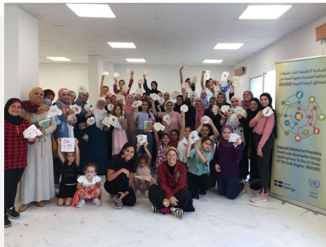
دورة تدريبية عن الحياكة والتطريز في بلدة عكار العتيقة، عكار، لبنان