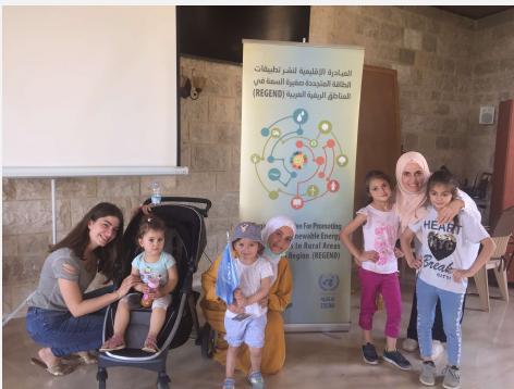
وجوه شابة في دورة تدريبية عن الإدارة المالية في بلدة الشقوف، عكار، لبنان