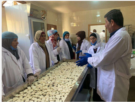
دورة تدريبية عن الممارسات الغذائية الجيدة في الأشعري، معان، الأردن