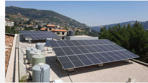
نظام طاقة شمسية سعة 25 كيلو واط، ونظام تسخين مياه في مبنى تعاونيات تصنيع مواد غذائية في عكار العتيقة، عكار، لبنان