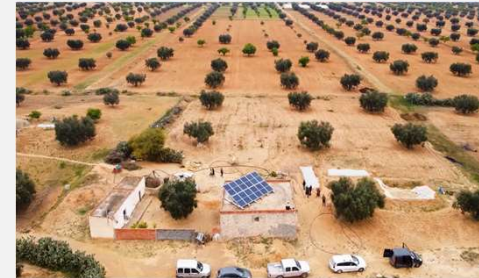
نظام طاقة شمسية سعة 4.5 كيلو واط في مزرعة في شربان، المهديّة، تونس