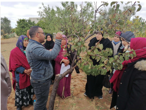
دورة تدريبية عن الممارسات الزراعية الجيدة في شربان، المهديّة، تونس