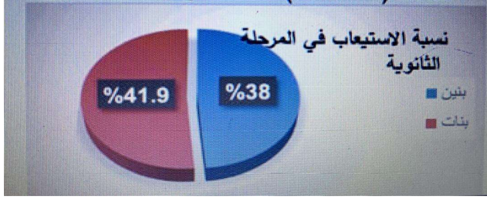
جدول رقم (3) نسبة الإستهيعاب في المرحلة الثانوية